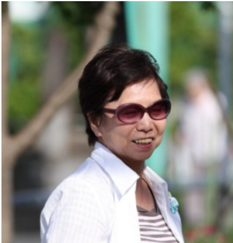
折り紙、切り絵の教室で、皆さんと共に勉強をさせていただいております。日常生活の合い間に、気軽に思いついたイメージや構想をステップアップとなる様勉強中です。