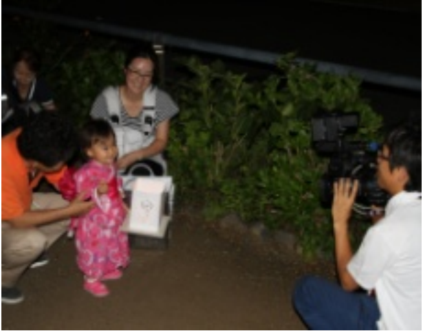
取材の報道カメラに笑顔で応じるお親子さん

森とせせらぎネットワーク主催 【灯ろう流し】 こころ込めて灯ろう流しのキット作り